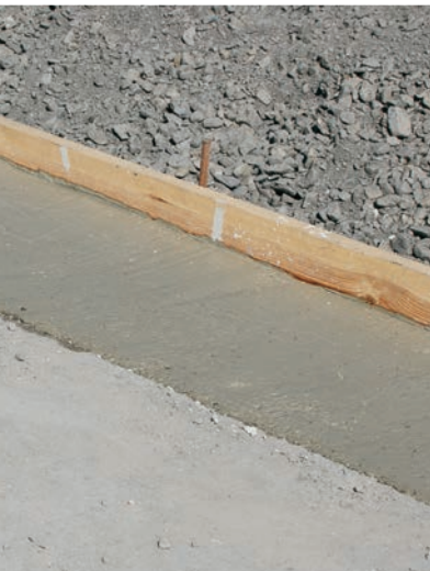
Fundament für eine Gartenmauer

C25/30, XC4, XF1, XA1 C30/37, XC4, XF1, XA1, XD1, XS1