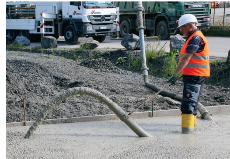
Herstellung einer Bodenplatte mit ergoton® plus und Einsatz einer Betonpumpe