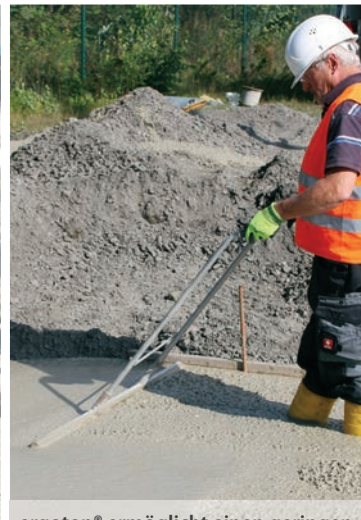
ergoton® ermöglicht einen geringen Verdichtungsaufwand