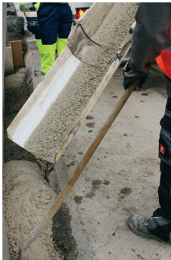
Betonage eines Streifenfundaments