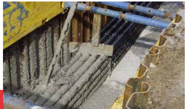
fūma boden® für die Einbettung von Gasleitungen

Unzureichende Verdichtung konventioneller Verfüllbaustoffe stellt ein häufiges Problem im Leitungsbau dar. Die Ursachen reichen von mangelhafter Bauausführung über vorhandene und den Bauablauf störende Leitungen im Graben bis hin zu Platzmangel während der Bauphase. Bestandsgebäude in der Nähe neu verlegter Leitungen dürfen häufig nicht durch Schwingungsemissionen beansprucht werden – dies beeinträchtigt die Qualität der Verdichtung. Aufwendig zu sanierende Schäden wie Risse, Brüche oder Lageabweichungen an neu verlegten Rohrleitungen sind die Folge. Hier bietet fūma boden® die optimale Lösung. Häufig auftretende Verlegefehler und daraus mittel- bzw. unmittelbar resultierende Schadensursachen werden bei der Verwendung von fūma boden® von vornherein vermieden. Die Bauzeit wird verkürzt, und erhebliche Kosten werden eingespart.